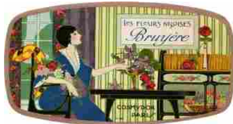
Les fleurs nicoises Bruyère, 1930-40 Pubblicità profumeria Cosmydor, Parigi Etichetta per scatola di saponi profumati

Dal 15 Settembre 2017 al 18 Febbraio 2018